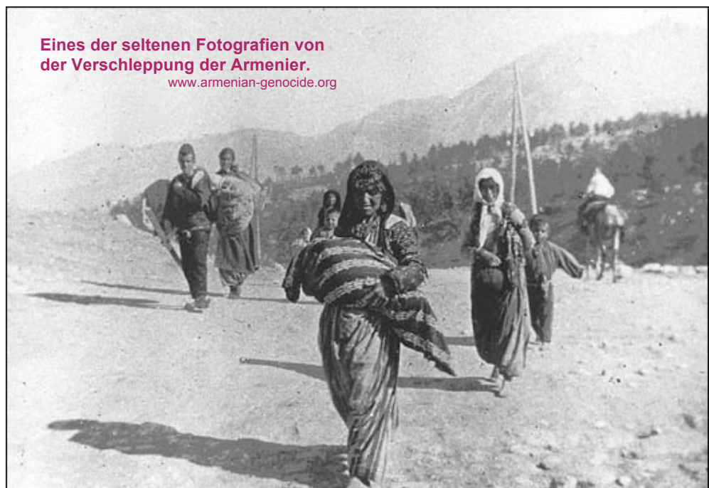
Eines der seltenen Fotografien von der Verschleppung der Armenier.

Nichts wurde von den Planern und Tätern ausgelassen, um die „Armenierfrage“ ein für allemal zu lösen. Bereits 20 Jahre zuvor versuchte der brutale Sultan Abdul Hamid die Armenier zu massakrieren. Zwischen 1894 und 1897 ermordeten türkische Soldaten mindestens 312.000 Armenier. Allein in der Provinz Kilikien zerstörte man 2.500 Dörfer und 500 Kirchen. Durch die Interventionen von Russland und Großbritannien konnte das Morden verhindert werden. Jetzt, im Ersten Weltkrieg, scherte man sich nicht mehr um die Meinung des Auslandes, das jetzt sowieso der Feind war. Einzig der deutsche Bündnispartner setzte kurzfristig einen matten